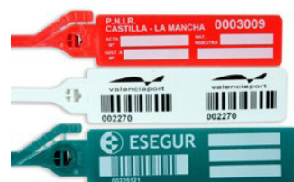
GRIP SEGUR 'POST'