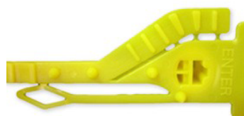
GRIP SEGUR 'POST'